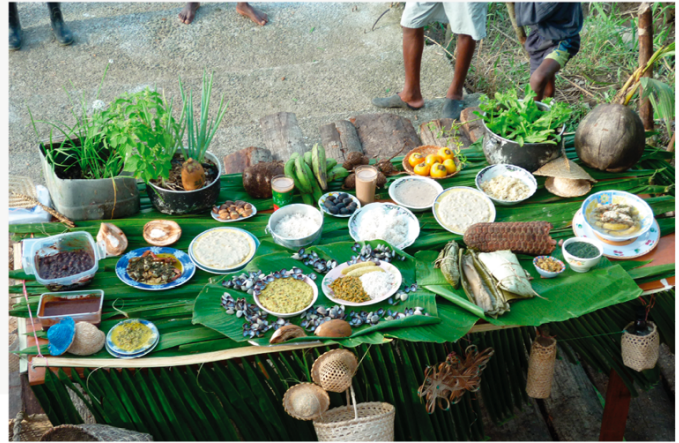
Figura 13.1 Biodiversidade e práticas culinárias em comunidade de afrodescendentes no território florestal na região do Pacífico colombiano. Grupos afro-pacíficos migraram para a Amazônia colombiana em diferentes épocas, em busca de alternativas de subsistência e liberdade. A) inventário de espécies de plantas e sua distribuição espacial em lote de terra familiar de afrodescendentes; B) 21 pratos e utensílios diferentes produzidos na comunidade Bubuey do Conselho da Comunidade Negros em Acción.